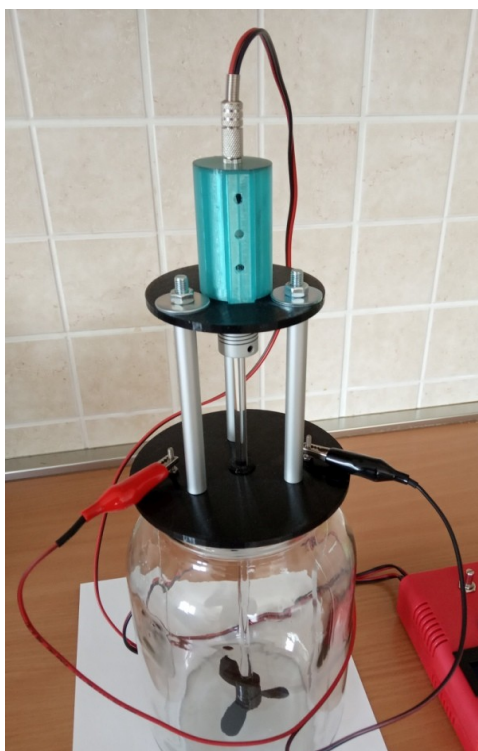
Ispravno spojena miješalice

Prije pokretanja uređaja potrebno je spojiti kabele s štipaljka na vidice kojima su elektrode učvršćene, a drugi kabel s 3.5 mm nastavkom spojiti na vrh uređaja u utičnicu na motoru