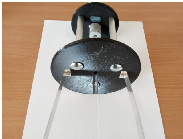
Konačan izgled sastavljene miješalice s elektrodama

Učvrstite elektrode na donji stalak s 3mm inox vidicama na način da elektrode ravnim dijelom budu okrenute prema vani (naslonjene uz stijenku grla tegle) te jedna prema drugoj sučeljene i da vide budu okrenute prema gore kako bi se kasnije na njih mogle nakačiti štipaljke kabela.